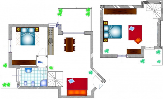
Appartamento Piano Primo con Mansarda n° 6 scala C / D